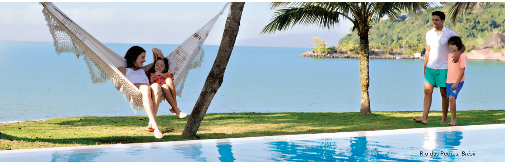
Rio das Pedras, Brésil